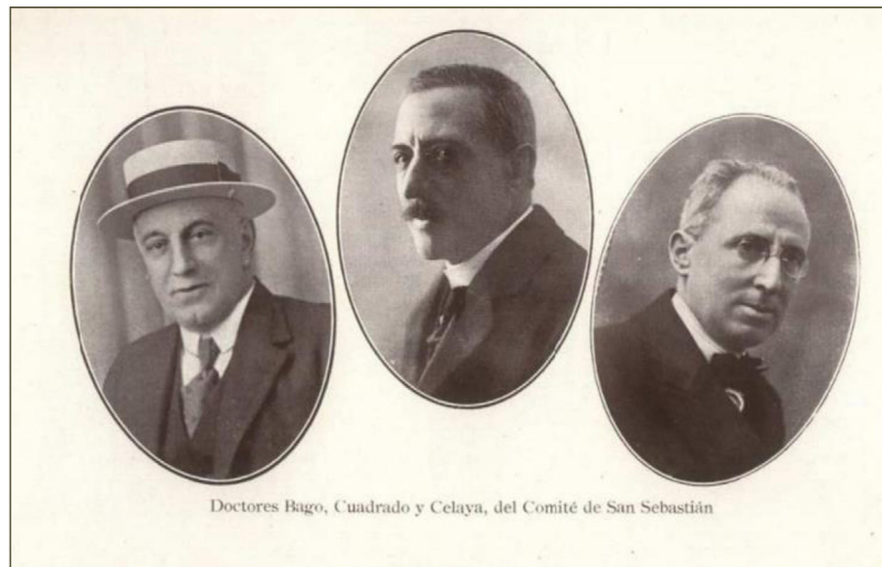
Figura 2 Comité de San Sebastián del II Congreso Nacional de Pediatría (Libro de Actas del Congreso, tomo I, p. 40).