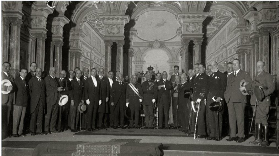
Figura 3 Inauguración del Congreso en el Teatro Victoria Eugenia.