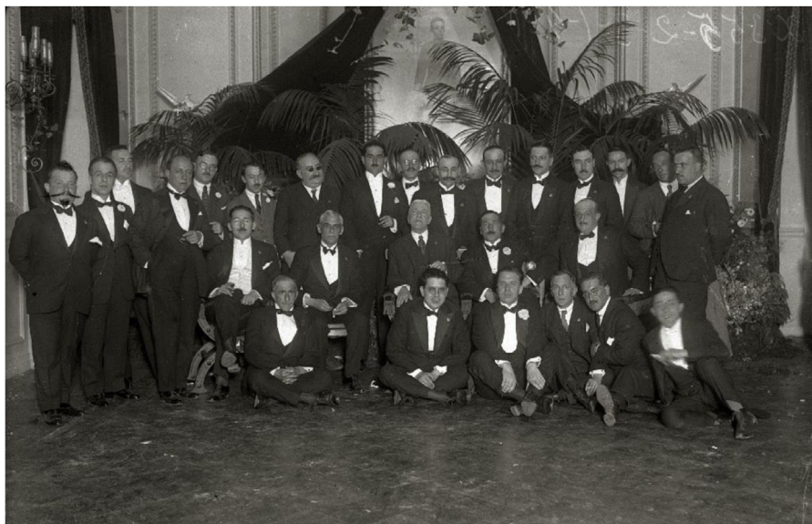
Figura 4 Recepción en el Aero-Club ofrecida a los asistentes al Congreso. Imagen tomada de Fototeka-Kutxa (fotógrafo Pascual Marín). Disponible en: https://www.kutxateka.eus/Detail/objects/37751/s/0 .