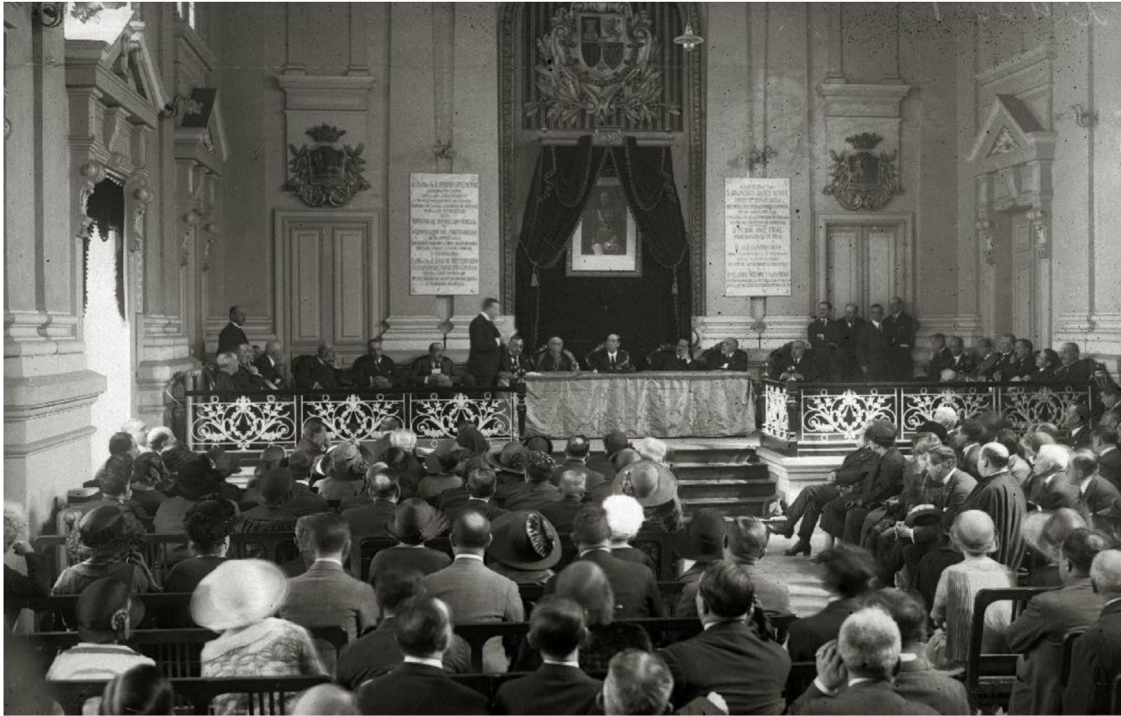
Figura 8 Sesión de Clausura.

tratamiento del prolapso uretral o de los tumores vaginales y un caso de hematócolpos voluminoso por imperforación de la vagina en una niña de trece años. Como puede observarse, hizo un completo repaso y puesta al día de la patología genital de las niñas y de las adolescentes.