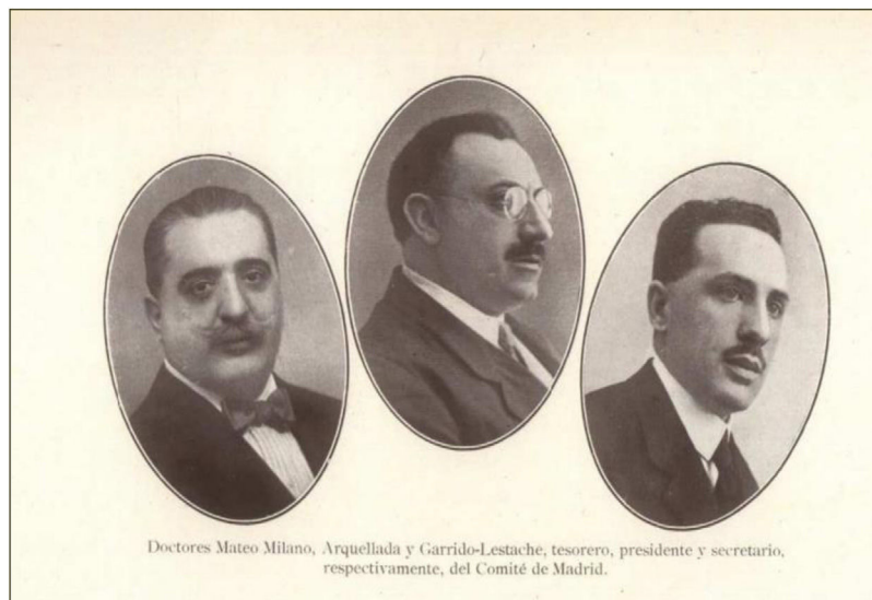
Figura 1 Comité de Madrid del II Congreso Nacional de Pediatría (Libro de Actas del Congreso, tomo I, p. 40).

El Congreso contó con cinco secciones: Higiene infantil, Medicina infantil, Cirugía infantil y ortopedia, Protección a la infancia y Pedagogía. Sería muy prolijo enumerar toda la actividad del Congreso, que fue muy extensa. Es por eso que, para dar una imagen de la actividad científica del mismo, vamos a tomar un hilo conductor que es la lucha contra la mortalidad infantil, que de forma transversal estuvo presente en las actividades de la mayoría de las secciones y concuerda con el lema general de la reunión: «Por los niños y la humanidad». También fue muy numerosa la participación de médicos y pediatras, que llegó a un número de 320. La mayoría fueron de Madrid, seguidos de los de Guipúzcoa, Barcelona, Andalucía, Zaragoza y Valencia (fig. 5).