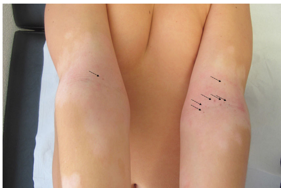
Figura 3 Tras un año sin tacrolimus, persistencia de lesiones en huecos antecubitales (→).

pocos casos biopsiados, el estudio histopatológico muestra aumento de melanocitos epidérmicos y leve incontinencia pigmentaria 1,3 .