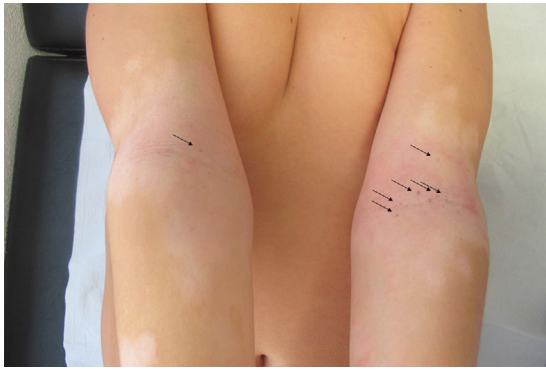
Figura 3 Tras un año sin tacrolimus, persistencia de lesiones en huecos antecubitales (→).

pocos casos biopsiados, el estudio histopatológico muestra aumento de melanocitos epidérmicos y leve incontinencia pigmentaria 1,3 .