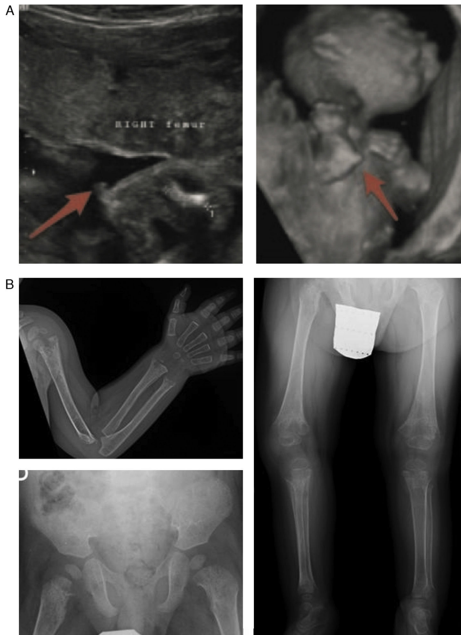
Figura 2 Hallazgos característicos en las pruebas de imagen de la hipofosfatasa perinatal letal (a) y de la hipofosfatasa del lactante (b). a) Ultrasonografía a las 18 semanas de gestación: espolones óseos en la rodilla derecha y en el codo derecho (3D). b) Estudio radiológico en paciente de 17 meses de edad: marcada alteración en metafisis de huesos largos (proximales de ambos húmeros, distales de ambos radios y cúbitos y proximales de ambos fémures, tibias y peronés), que se encuentran ensanchadas, con pérdida de densidad ósea, trabéculas groseras y proyecciones radiolucientes que se extienden desde la fisis hacia la metafisis. Reacción perióstica lineal en el radio izquierdo.

Imágenes reproducidas con permiso de Zankl A, Mornet E, Wong S. Specific ultrasonography features of perinatal lethal hypophosphatasia. Am J Med Gen Part A. 2008;146A:1200-1204, y Caballero Mora FJ, Martos Moreno GA, García Esparza E, Argente J. Hipofosfatasa infantil. An Pediatr. 2012;76:368-369.