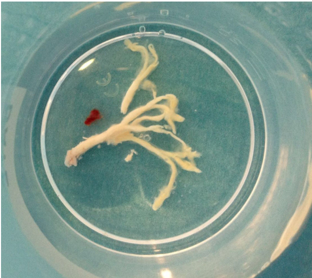
Figura 2 Molde bronquial extraído con broncoscopia rígida.