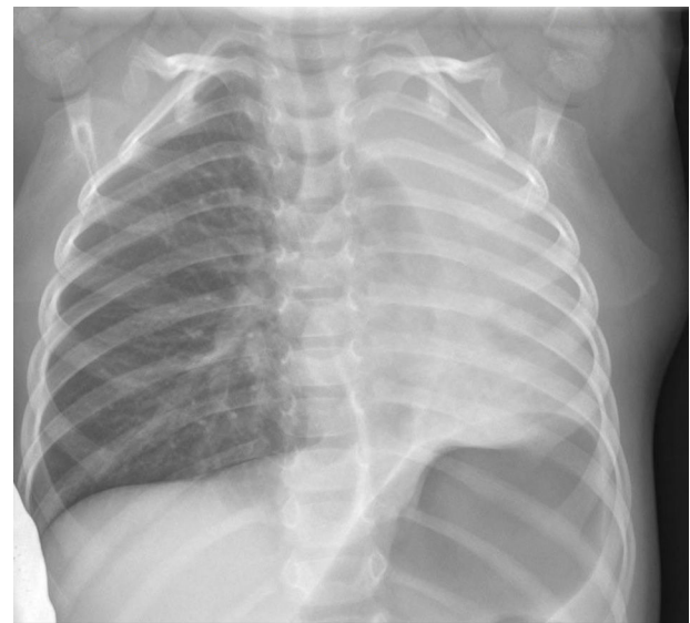
Figura 1 Atelectasia completa de pulmón izquierdo.

A las 24 h permanece asintomático, con resolución completa de la atelectasia (fig. 3), por lo que se decide alta a domicilio con tratamiento antiasmático, sin presentar recidivas.