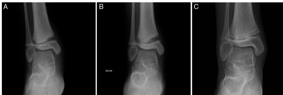
Figura 1 Radiografías del tobillo afectado. A) Osteopenia. Áreas de resorción ósea, tanto en vertiente medial como lateral de la metáfisis distal de la tibia, adyacente a la fisis. Aumento de partes blandas adyacente al maléolo tibial. B) Progresión con ensanchamiento de la fisis. C) Mejoría radiológica tras el reposo y la inmovilización.

Niña de 8 años que acude por tumefacción no dolorosa y aumento de temperatura local en el tobillo derecho. Afebril, no refiere traumatismos. Camina más por haber cambiado