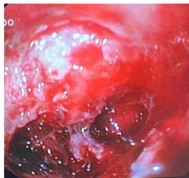
Figura 1 Úlcera duodenal con sangrado activo.

A su llegada se encuentra inestable, realizadas pruebas complementarias: TC craneal, analítica sanguínea y endoscopia digestiva alta (EDA), donde objetivamos gran úlcera en bulbo duodenal excavada (Forrest Ib) (fig. 1) y esofagitis grado D de los Ángeles. Durante la técnica comienza con sangrado masivo precisando maniobras de resucitación, se inyecta adrenalina y etoxiesclerol en mucosa conservada. Ante la persistencia de sangrado se realiza arteriografía con embolización de arteria gastroduodenal (fig. 2), sin evidenciar sangrados posteriores. Se inicia tratamiento con inhibidores de la bomba de protones (IBP) a dosis altas. Se descarta malignidad y la presencia H. pylori en el estudio anatomopatológico, gastrina sérica basal y gammagrafía con receptores de somatostatina (SPECT-TC), con resultado normal.