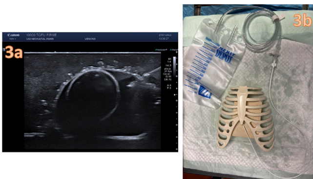
Figura 3 Construcción del modelo de pericardiocentesis guiada por ultrasonido de tofu. a) Pericardiocentesis guiada ecográficamente. a) Set de pericardiocentesis instalado completo.

Se trata, además, de un procedimiento poco frecuente y de alto riesgo donde el entrenamiento mediante simulación en técnicas ecoguiadas proporciona un entorno cómodo, de bajo estrés e idóneo para el aprendizaje. Fomenta la seguridad del paciente al evitar la mala praxis de realizar una técnica sin la habilidad o la experiencia oportunas, o incluso evitar otros aspectos éticos negativos, como la práctica en animales.