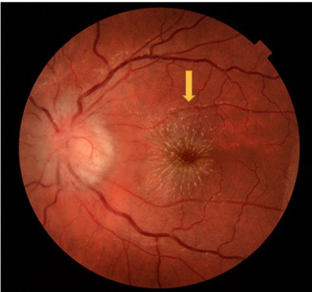
Figura 3 Edema de papila y exudado en área macular (estrella macular) del ojo izquierdo a la semana del diagnóstico (flecha).