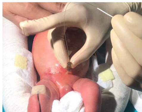
Figura 1 Punción en hipogastrio. Se observa el paso de guía tras retirada de la aguja del angiocatéter.

Mediante ecografía, se procedió a punción con angiocatéter 16 G en hipogastrio (fig. 1). Se retiró la aguja del angiocatéter y se pasó guía 0,018'') hasta vejiga. Sobre guía y a través del angiocatéter, se introdujo catéter doble J Sof-Flex® Multi-Length Stent Set 3 Ch - 12 cm (Cook Medical, Bloomington, IN, EE. UU.), comprobando correcta colocación mediante ecografía (figs. 2-3). Se fijó catéter con