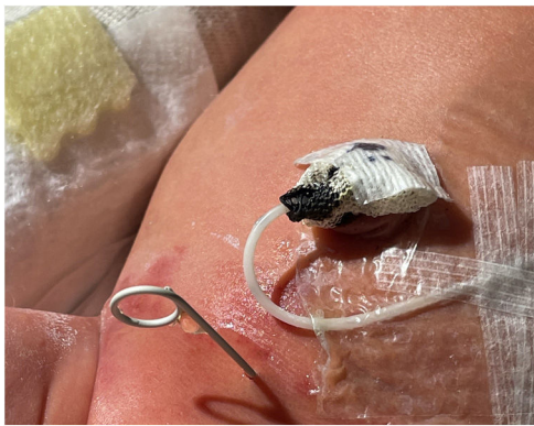
Figura 2 Catéter doble J en hipogastrio con salida de orina clara.