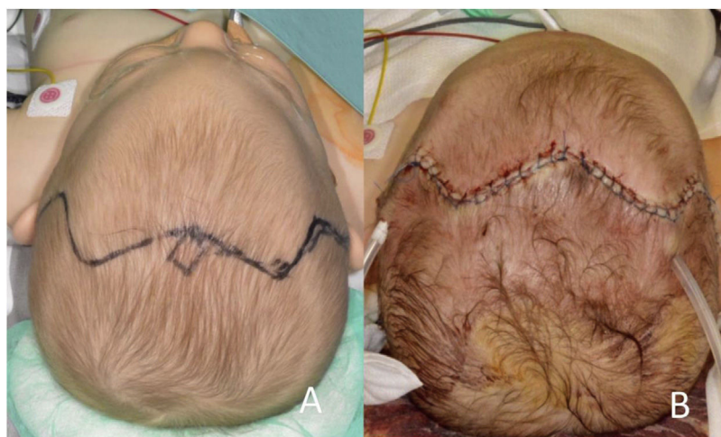
Figura 3 Comparación de la planificación prequirúrgica (A) con el posquirúrgico (B). Se puede observar con claridad como la frente adopta una forma mucho más redondeada y fisiológica.

La impresión 3D es, por tanto, una técnica que puede revolucionar el tratamiento quirúrgico de diversas enfermedades, entre ellas la trigonocefalia. No obstante, es importante saber que es solamente una ayuda para el