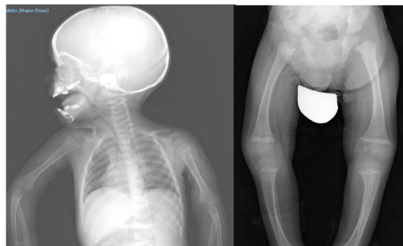
Figura 2 Desmineralización generalizada, incurvación de huesos largos. Imagen en cáliz o copa, más llamativa en húmero y fémur.