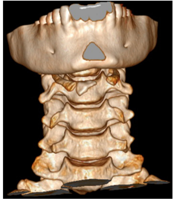
Figura 3 Reconstrucción tridimensional con tomografía computarizada.