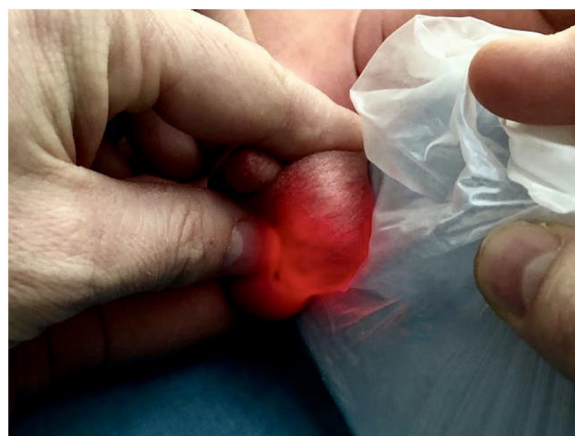
Figura 1 Transiluminación de la bolsa escrotal visualizando septos en su interior.

Se realiza orquiectomía radical a los 35 días de vida siendo la evolución satisfactoria con normalización de AFP a los nueve meses de edad.