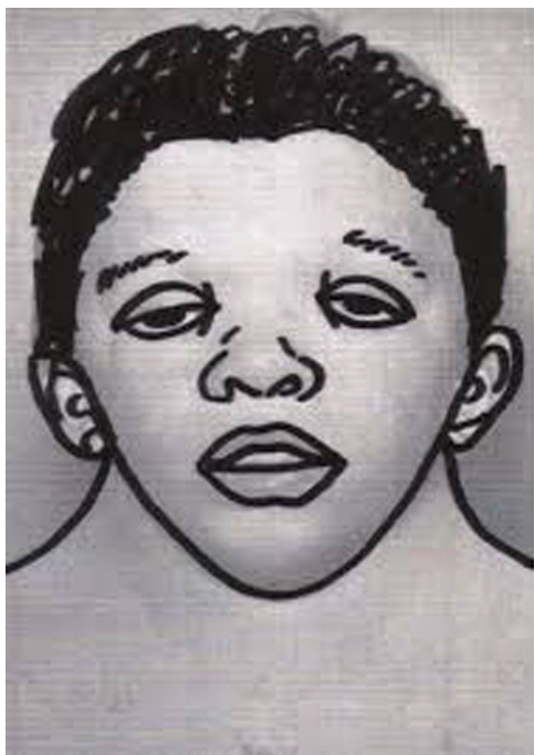
Figura 1 Ilustración esquemática del aspecto facial típico en el síndrome de Noonan.

diagnóstico prenatal es infrecuente. Se describe un amplio espectro de alteraciones siendo la más común la estenosis pulmonar frecuentemente con válvulas displásicas (50-60%), la miocardiopatía hipertrófica (20%) 4 , usualmente presente en etapas tempranas de la vida 5 , defectos del septum atrial (6-10%) y ventricular, estenosis de la rama de la arteria pulmonar, anomalías de la válvula mitral, arterias coronarias, coartación de la aorta y, menos frecuente, la tetralogía de Fallot o ductus arterioso permeable.