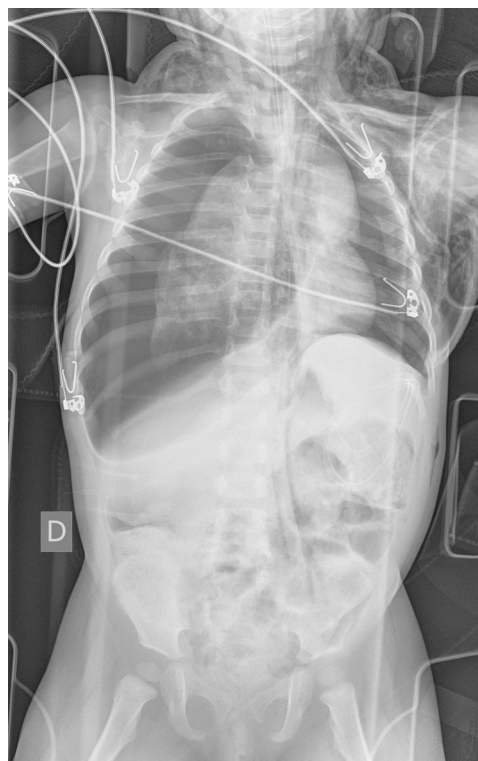
Figura 1 Imagen mediante radiografía portátil de tórax y abdomen en la que se aprecia neumotórax derecho a tensión, neumotórax izquierdo, enfisema subcutáneo cervical y en pared lateral del tórax y neumorretroperitoneo.

Se han documentado únicamente 2 casos de neumorraquis con afectación del raquis completo 1,2 , siendo más frecuente la presencia de aire a nivel exclusivamente cervical o lumbar.