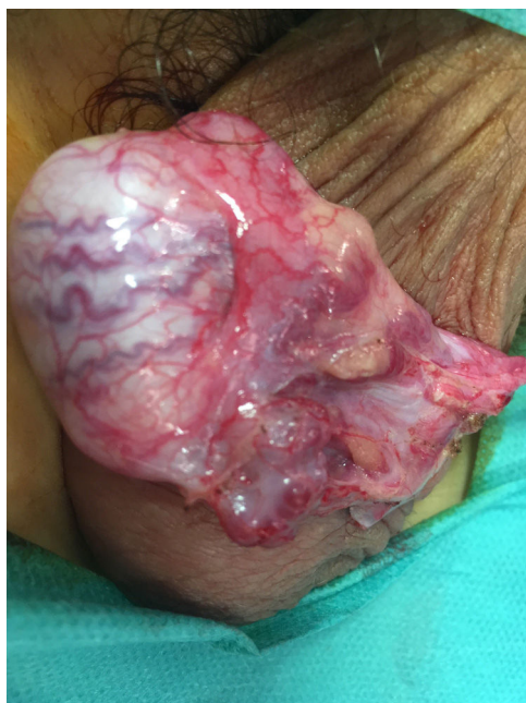
Figura 3 Imagen quirúrgica: se visualiza lesión quística/vascular no infiltrativa adyacente al polo inferior del testículo. La lesión se extirpó quirúrgicamente.

El estudio histológico de la pieza mostró una proliferación lobular de capilares y endotelio de una sola capa, sin atipia. La inmunohistoquímica fue positiva para WT1 y D2-40 y negativa para GLUT-1. Se diagnosticó granuloma piogénico.