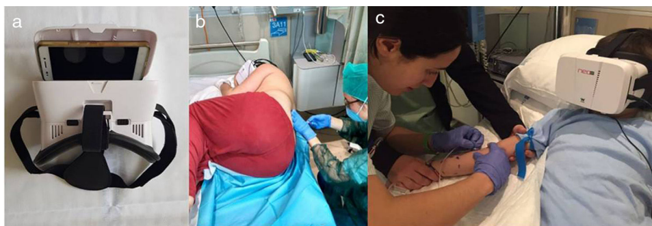
Figura 1 a) Gafas modelo Wortex Neox VR1 asociadas a dispositivo móvil. b) Paciente utilizando las gafas de RV durante la realización de una punción lumbar. c) Paciente utilizando las gafas de RV durante la realización de una extracción analítica.

pediátrica (noviembre 2016-junio 2018), que requirieron la realización de un procedimiento invasivo.