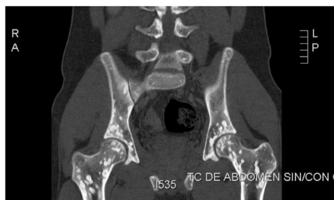
Figura 2 Tomografía computarizada.