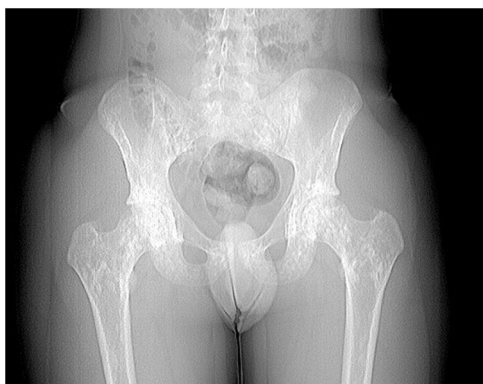
Figura 1 Radiografía de caderas.

Disponible en Internet el 30 de octubre de 2018