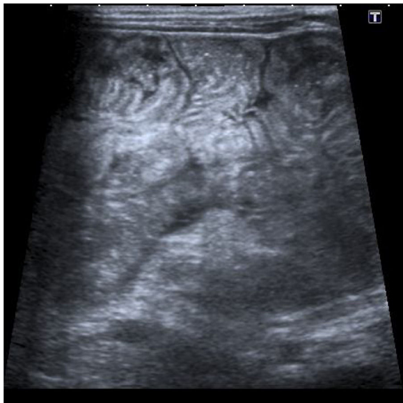
Figura 2 Ecografía abdominal con edema de pared intestinal.