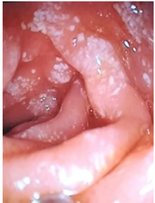
Figura 3 Endoscopia digestiva alta: imagen «en copos de nieve» a nivel duodenal.

Se inicia dietoterapia hiperproteica e hipograsa con suplementos con MCT sin mejoría inicial, precisando asociar propranolol 3 a 2 mg/kg/día durante 7 meses hasta normalización progresiva clínico-analítica, permitiendo suspenderlo, actualmente se mantiene buen control con dieta.