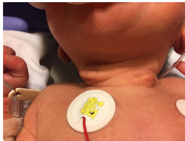
Figura 1 Apéndices laterocervicales sin orificio de salida, de consistencia cartilaginosa.

Los vestigios condrocútaneos cervicales son lesiones congénitas benignas poco frecuentes, asintomáticas, localizadas en posición anterior al músculo esternocleidomastoideo, secundarias a un remanente de los arcos branquiales (predominantemente el segundo arco branquial) 1 . Se componen de tejido cutáneo con núcleo cartilaginoso, sin incluir estructuras vasculares en su interior. Son más comunes en varones, y pueden tener asociación familiar 2 . El carácter bilateral es muy infrecuente, presentando una mayor incidencia de malformaciones, tales como: cardíacas (defectos del septo auricular), gastrointestinales (hernia inguinal),