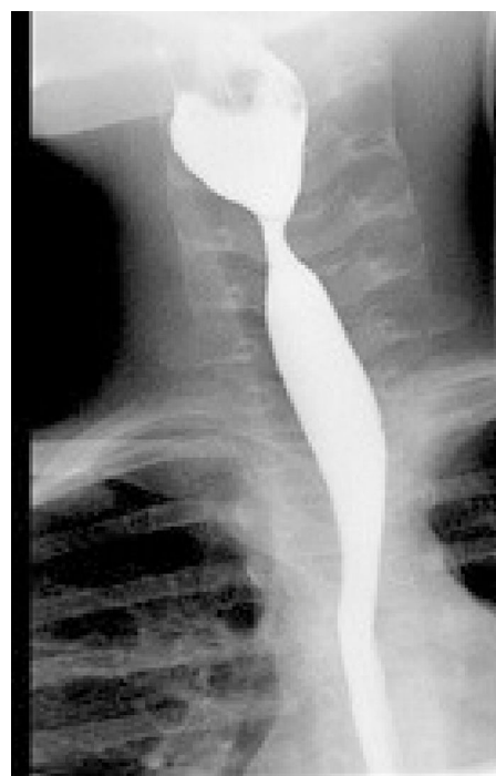
Figura 2 Tránsito digestivo superior (AP): se observa estrechamiento en el tercio esofágico.