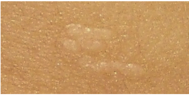
Figura 2 Se aprecian las lesiones descritas, máculas papulosas de color piel sin franca hiperqueratosis en tronco y pierna.