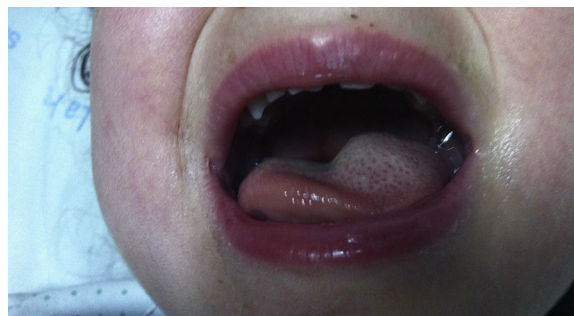
Figura 1 Fotografía de la cavidad oral que muestra engrosamiento de la hemilengua izquierda.

El hemograma, perfil básico y nivel de proteína C-reactiva fueron normales, así como las radiografías lateral de cuello y de tórax. La RM craneal mostró un tumor sólido (fig. 2), con extensión intra- y extracraneal. La biopsia con aguja fina guiada por TC mostró células redondas azules de pequeño tamaño. El estudio inmunohistoquímico fue positivo para CD99, y negativo para CD45, MyoD1 y antígeno de membrana epitelial, indicando sarcoma de Ewing. A las 48 h del