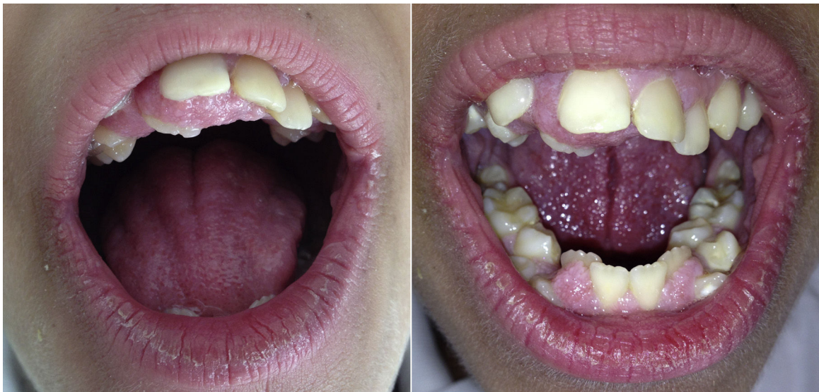
Figura 2 Apiñamiento dental e hipertrofia gingival en el síndrome de Rabson-Mendenhall.