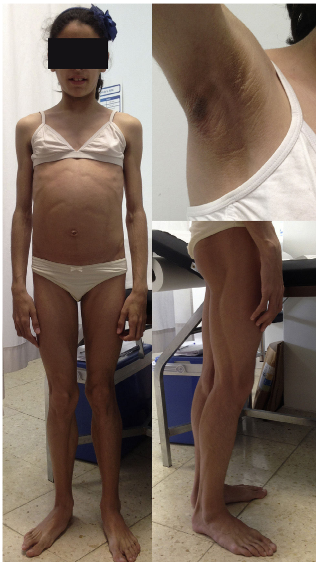
Figura 3 Niña de 12 años que padece una lipodistrofia generalizada adquirida (síndrome de Lawrence), y en la que se aprecia la ausencia generalizada de tejido adiposo, la musculatura bien definida y la acantosis nigricans.