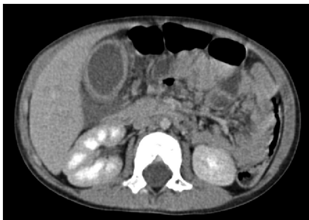
Figura 2 TC helicoidal multicorte con contraste por vía intravenosa. Importante engrosamiento de la pared vesicular y edema perivesicular, aumento de densidad y líquido en la grasa mesentérica posterior.

imágenes con sospecha de gangrena de la vesícula biliar, se decide el traslado del paciente al servicio de cirugía pediátrica de referencia en la comunidad donde se procede a su abordaje quirúrgico confirmándose el diagnóstico de colecistitis aguda gangrenosa.