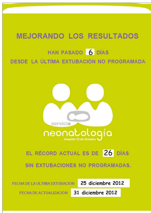
Figura 1 Cartel informativo que se actualiza diariamente, donde se muestra la fecha cuando ocurrió la última ENP, el número de días transcurridos desde la última ENP y el récord de días consecutivos sin ninguna ENP.

Dado que la ENP se considera un evento adverso y en nuestra UCIN existe un programa de recogida de información sobre eventos adversos, el consentimiento informado, como