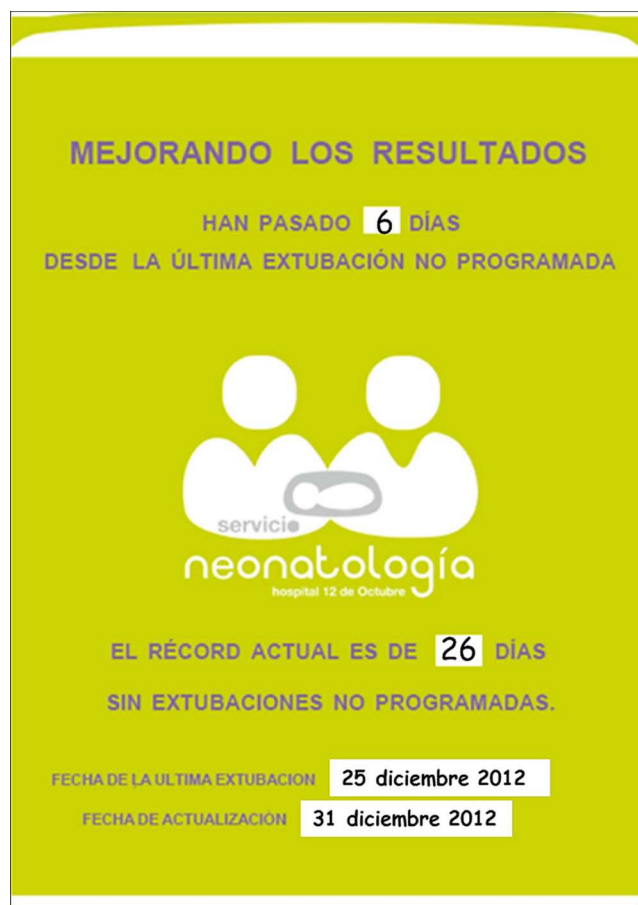
Figura 1 Cartel informativo que se actualiza diariamente, donde se muestra la fecha cuando ocurrió la última ENP, el número de días transcurridos desde la última ENP y el récord de días consecutivos sin ninguna ENP.

Dado que la ENP se considera un evento adverso y en nuestra UCIN existe un programa de recogida de información sobre eventos adversos, el consentimiento informado, como