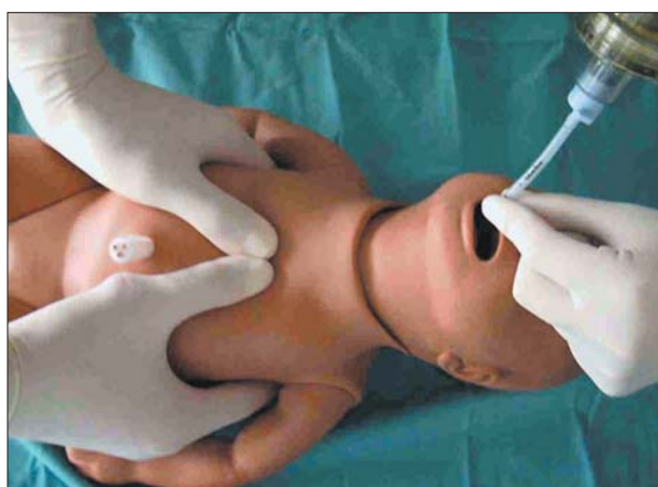
Figura 3. Masaje cardíaco. Técnica de los dos pulgares.