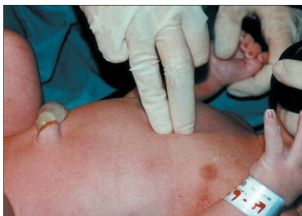
Figura 4. Masaje cardíaco. Técnica de los dos dedos.