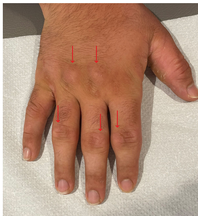
Figura 1 Nudillos acolchados (flechas) sobre las articulaciones metacarpofalángicas e interfalángicas proximales de la mano derecha.

Los nudillos acolchados, también conocidos como knuckle pads o nódulos de Garrod, son lesiones fibróticas sobre los dedos de pies y manos poco comunes 1 . En la edad pediátrica, estas lesiones suelen ser de origen traumático 2 . Se pueden