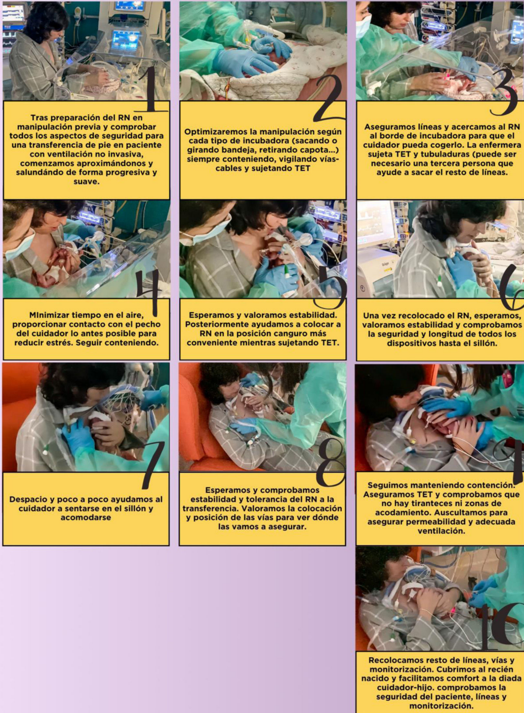
Ilustración 2. Diez pasos para una transferencia segura.

Puntos clave de la transferencia de pie de un Recién Nacido de alta complejidad (monitorización, intubación y prematuridad) llevada a cabo por el cuidador.