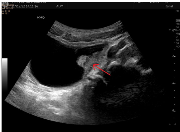
Figura 1 Imagen ecográfica en la que se observa lesión parietal de márgenes bien definidos, en la cara lateral izquierda de la vejiga.

c Consorci Sanitari Alt Penedès i Garraf, Sant Pere de Ribes, Barcelona, España