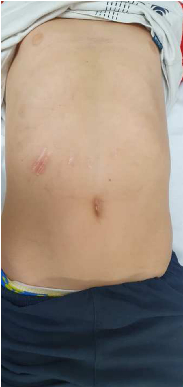
Figura 2 Se observa resolución completa de las lesiones cutáneas.