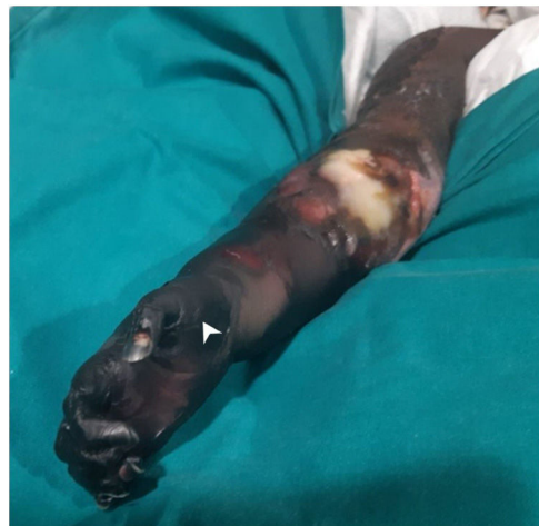
Figura 2 Fotografía. Visión macroscópica de isquemia distal MSD con progresión proximal y aparición de placas necróticas duras.

Niño de 13 meses, sin antecedentes de interés, que ingresa por shock tóxico refractario a aminas y síndrome de distrés respiratorio por neumonía necrotizante con empiema (fig. 1), secundario a SGA. Presenta datos de fallo multiorgánico, con disfunción ventricular, fallo hepático, renal, acidosis metabólica grave con hiperlactacidemia, preci-