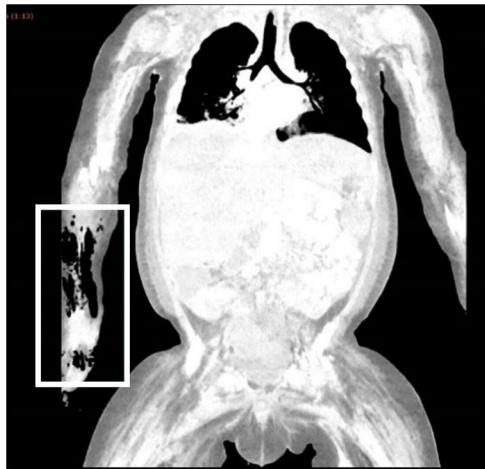
Figura 3 TC de tórax con contraste IV. Fascitis necrotizante de MSD con miositis parcheada e isquemia extensa de extremidades y tronco.

adecuación del esfuerzo terapéutico dada la necesidad de desarticulación, resección intestinal extensa y amputación de las cuatro extremidades.