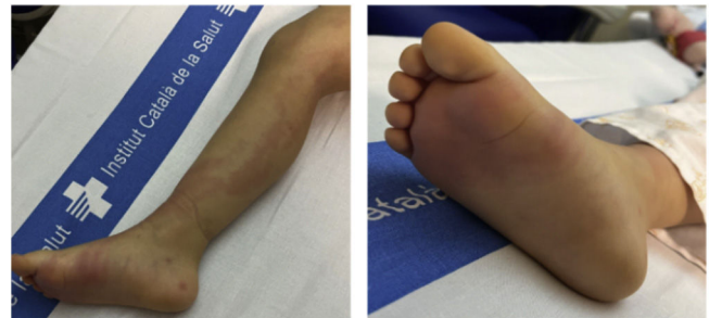
Figura 1 Lesiones cutáneas y tumefacción presentadas en la extremidad inferior derecha a las 12 horas del ingreso.

Ante la resonancia magnética (RM) local sugestiva (fig. 2), se orienta como fascitis necrotizante, indicando desbridamiento quirúrgico urgente y antibioterapia endovenosa. Los cultivos intraoperatorios y hemocultivo son positivos para Streptococcus pyogenes ( S. pyogenes ).