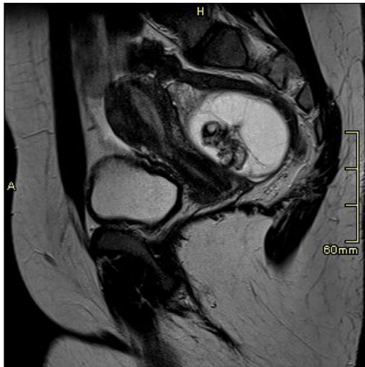
Figura 3 Resonancia magnética abdominal, secuencia T2, corte sagital. Lesión quística en fondo saco de Douglas de 74 x 54 mm de diámetro, hiperintensa en secuencias T2, multitabuada con polo de Rokitansky en localización anterior central, que incluye la existencia de piezas dentarias.

tejidos del ectodermo (pelo, grasa, dientes, piel...) 2 . La mayoría de las pacientes están asintomáticas al diagnós-