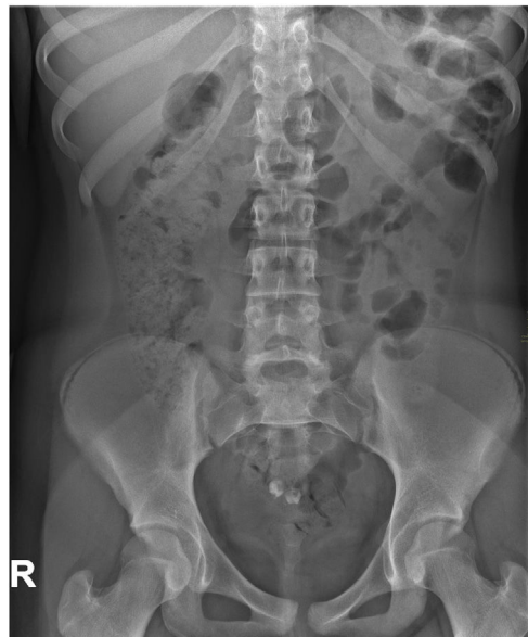
Figura 1 Radiografía simple anteroposterior de abdomen que muestra 2 imágenes con densidad calcio y forma de pieza dentaria en hipogastrio.

Los tumores ováricos son raros en pediatría, representando entre el 1-5% de los tumores infantiles. Hasta el 90% de estos tumores son germinales, siendo el más frecuente el teratoma maduro (55-70% de las neoplasias ováricas en pediatría) 1,2 . El teratoma maduro ovárico es una entidad benigna que puede aparecer a cualquier edad, pero la prevalencia más alta se da en mujeres en la segunda y tercera década de la vida. Proviene de al menos 2 de las 3 capas de células germinales, siendo lo más habitual encontrar