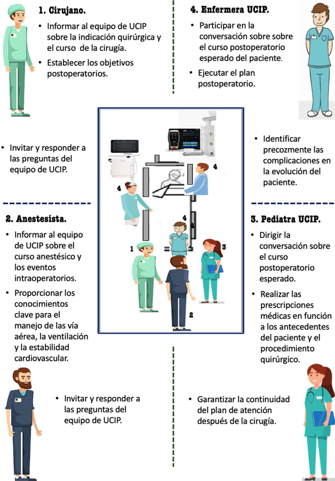
Figura 3 Profesionales que intervienen en la transferencia de pacientes entre quirófano y UCIP. Adaptado de Lane-Fall et al. Figuras «diseñadas por macrovector/Freepik».