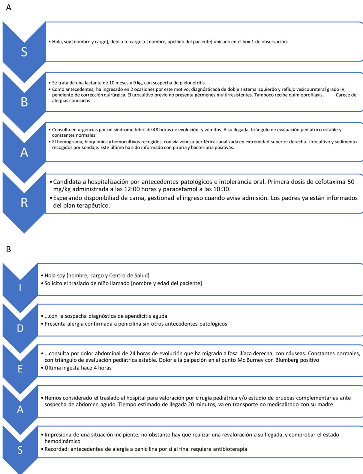
Figura 1 Ejemplo en dos supuestos clínicos del uso de herramientas de transferencia: A) método SBAR en un relevo asistencial en observación de la unidad de urgencias y B) método IDEAS en una derivación telefónica desde el Centro de Salud a urgencias hospitalarias. IDEAS: Identificación, Diagnóstico, Estado, Actuaciones, Signos y Síntomas de alarma. SBAR: Situation/situación, Background/antecedentes, Assessment/evaluación, Recommendation/recomendaciones.