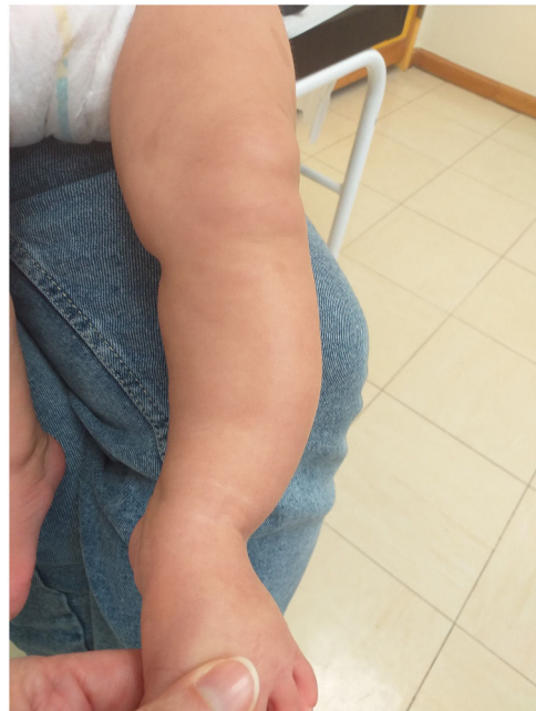
Figura 1 Asimetría de la pierna izquierda con curvatura pronunciada.

Las pruebas genéticas detectaron una variante patogénica en heterocigosis en el gen NF1 , con un patrón de herencia autosómica dominante.