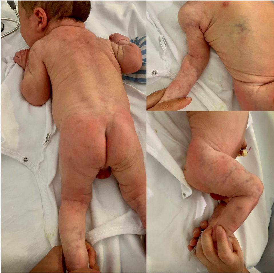
Figura 1 Lesiones vasculares presentes al nacimiento, características de cutis marmorata telangiectásica congénita.