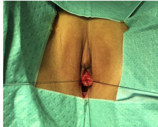
Figura 2 Suturas de referencia en los puntos cardinales de la mucosa prolapsada.

Presentamos el caso de una niña de 3 años de edad de raza negra, que consulta por sangrado genital de 1 mes de evolución. Presenta en la vulva una protrusión mucosa circunferencial y de superficie cruenta a través de la cual sale orina (fig. 1). Ecografía renal y pélvica normal. Es