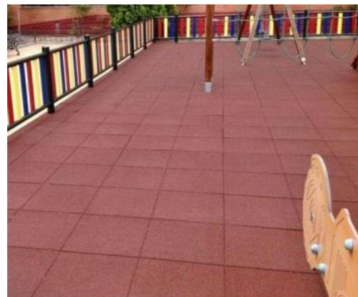
Figura 1 Suelo de caucho en un parque infantil habitual.

La radiografía torácica (fig. 2) muestra imagen sugestiva de cuerpo extraño. Se realiza fibrobroncoscopia flexible (Broncho Fiberscope FB-8 V, 2,7 mm, Pentax, Japan) urgente que confirma su presencia en bronquio principal derecho (fig. 3a). Se extrae mediante cesta recuperadora de piedras (NGage Nitinol Stone Extractor, 2.2 Fr, Cook Medical, Ireland), usada habitualmente para el tratamiento de urolitiasis (fig. 3b). Aunque el broncoscopio rígido es el método