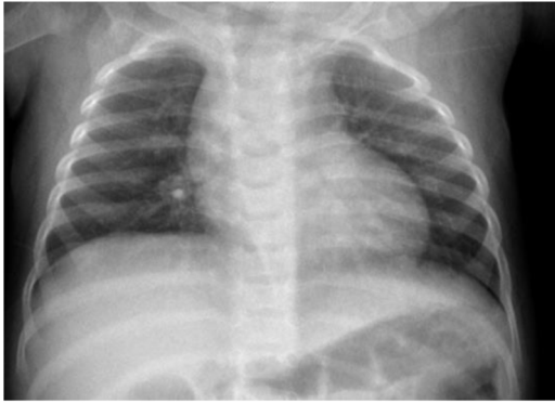
Figura 2 Radiografía de tórax. Imagen radiopaca en zona parahiliar derecha, sin signos de atrapamiento aéreo.

causa importante de muerte accidental en menores de un año 2 . Por consiguiente, es preciso incidir en medidas preventivas tales como revisar la idoneidad del uso de caucho en el suelo de parques infantiles, de acuerdo con las recomendaciones europeas 3 . Pese a sus ventajas, como la capacidad amortiguadora y resistencia al deslizamiento, su seguridad es cuestionable al no poder garantizarse su integridad estructural. Es fácilmente arrancado del suelo por los niños, sobre todo si el mantenimiento es deficitario, resultando en partículas de pequeño tamaño potencialmente causantes de episodios graves de broncoaspiración.