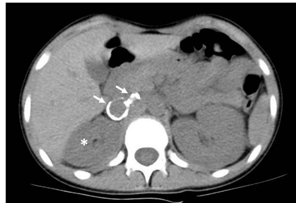
Figura 1 Angio-TC de abdomen, donde se observan dos aneurismas saculares en la arteria renal principal derecha con calcificaciones groseras en su pared (flechas), así como disminución del tamaño del riñón ipsilateral (asterisco).

Se decidió tratar inicialmente mediante angioplastia y colocación de stent , no siendo posible por embolización espontánea. Dada la persistencia de HTA y práctica anulación funcional renal derecha, se decidió nefrectomía derecha (fig. 2), con mejoría progresiva de tensiones y función renal. Histopatología compatible con displasia fibromuscular (DFM). Tras dos años está normotensa, sin tratamiento y el filtrado glomerular estimado según la fórmula de Schwartz modificada es 66 mL/min/1,73 m 2 .