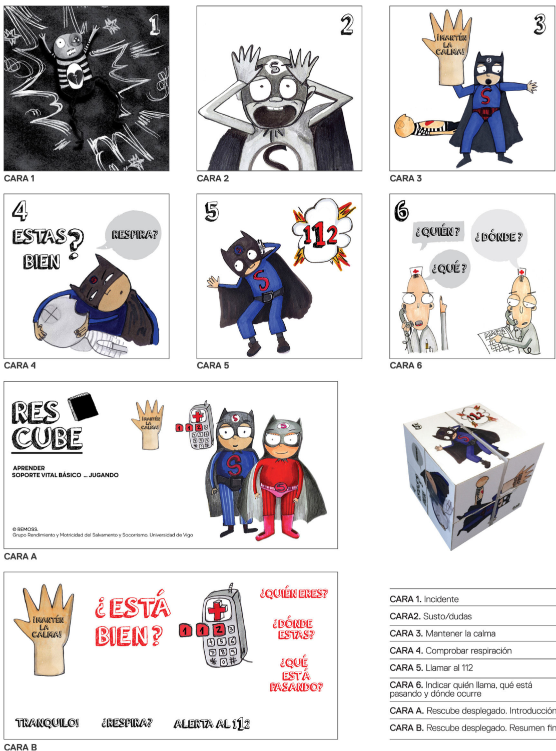
Figura 2 Descripción con imágenes del material desplegable Rescubate.

de validación se llevaron a cabo las recomendaciones aportadas por Yusoff 16 .