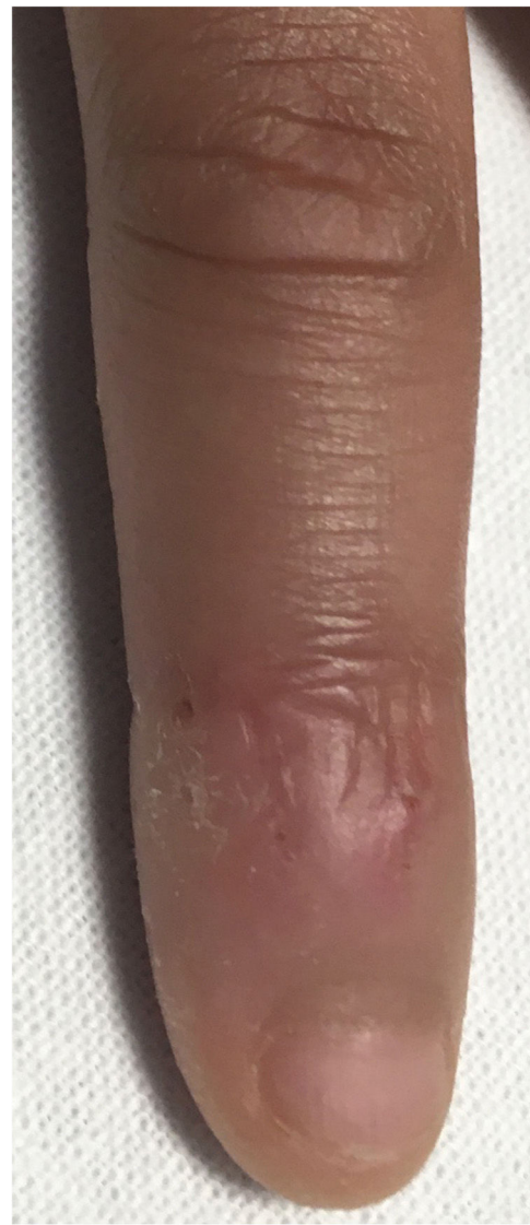
Figura 3 Lesiones edematosas.