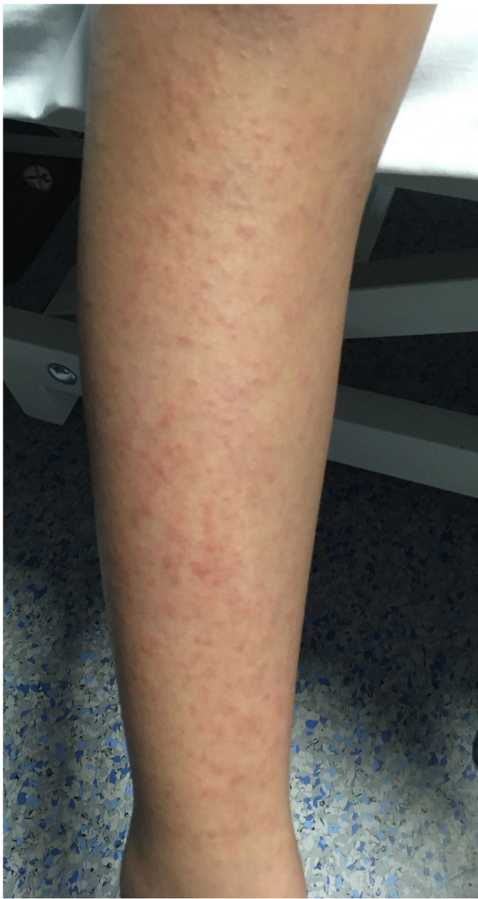
Figura 2 Erupción micropapular eritematosa.

La paciente recibió tratamiento con prednisona oral durante 3 días a 1 mg/kg, con posterior descenso a 0,5 mg/kg durante 2 días. La respuesta al tratamiento fue favorable, con mejoría significativa de las lesiones y desaparición del prurito a las 48 horas de iniciar el tratamiento; posteriormente, asintomática.