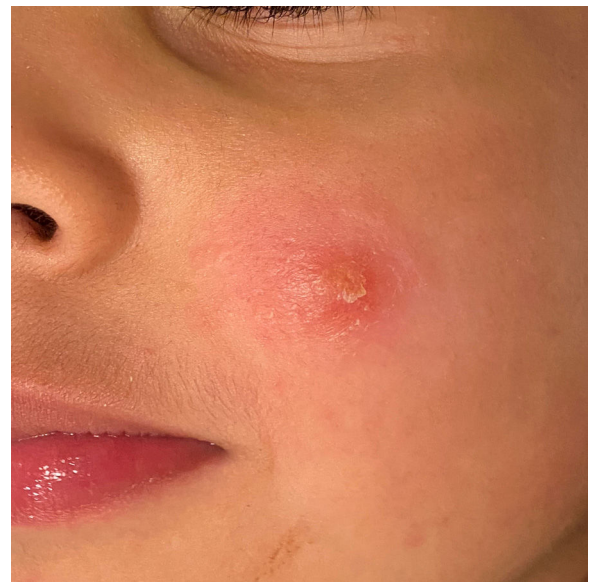
Figura 1 Placa eritematosa con costra central localizada en mejilla izquierda.

Para obtener la confirmación diagnóstica se optó por realizar una visualización directa del parásito mediante