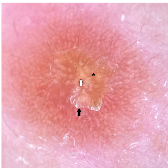
Figura 2 A la dermatoscopia de luz polarizada se aprecia eritema generalizado, tonalidad amarillenta en el centro de la lesión (asterisco), hiperqueratosis central (flecha negra) y estructuras en forma de lágrimas amarillas (flecha blanca) (DLP, x10).

posteriormente. Las muestras se tiñeron con Giemsa y se examinaron al microscopio óptico con ocular de x10 y objetivo de x100 en aceite de inmersión, objetivándose múltiples amastigotes de Leishmania sp. en los macrófagos encontrados (fig. 3).