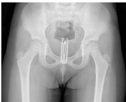
Figura 2 Radiografía simple de pelvis en la que se observa el cuerpo extraño.

Las posibles complicaciones incluyen la ulceración de la pared vaginal con formación de fístulas y la infección 3 . Los casos reportados se han dado casi exclusivamente en la edad pediátrica, lo que plantea un reto diagnóstico y pone de relieve la importancia de las pruebas complementarias de imagen en la aproximación diagnóstica 3 .