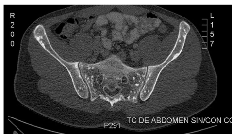
Figura 3 Tomografía computarizada.

Niño de 15 años presenta dolor en cadera derecha e impotencia funcional tras caída en bicicleta. Se realiza radiografía de caderas que no muestra fractura, pero se observa hallazgo radiológico accidental en articulación coxo-femoral (fig. 1).