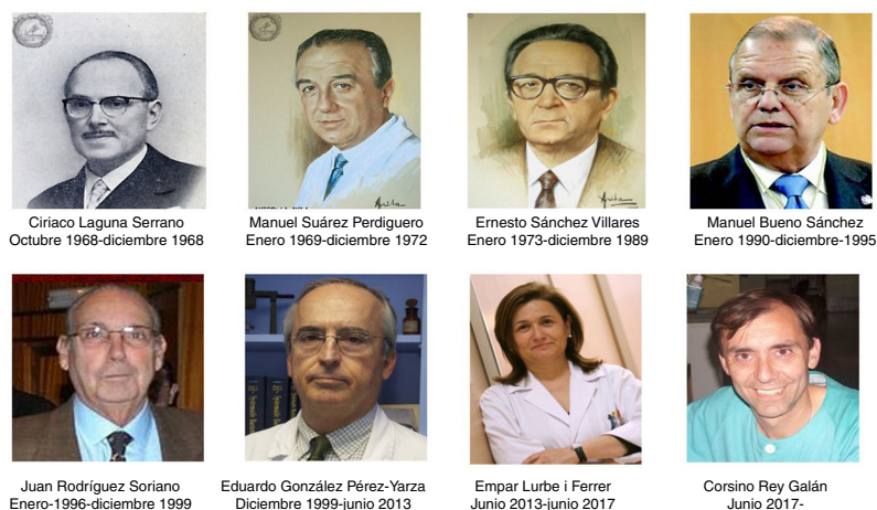
Figura 1 Directores de Anales Españoles de Pediatría y Anales de Pediatría .

Tomadas de internet, con conocimiento de sus protagonistas, especialmente de www.bancodeimagenesmedicina.com .