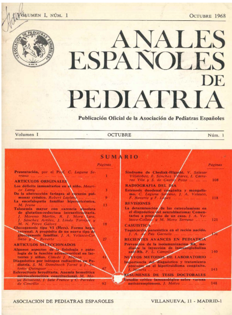
Figura 2 Portada del primer número de Anales Españoles de Pediatría (octubre de 1968).

Desde 1973 hasta 1976 las secciones fueron: Artículos originales, Reseñas, Sección de casuística, Diagnóstico y tratamiento, Pediatría práctica («Pediatría pediátrica» figura en los primeros volúmenes) y Cirugía. La cirugía pediátrica estuvo muy presente los primeros años, incluidos sus Congresos y Reuniones, hasta que se comenzó a editar la revista Cirugía Pediátrica . Otras secciones fueron: Educación pediátrica, Secciones de especialidad (algunas de ellas publicaron los resúmenes de las comunicaciones de sus primeras reuniones), Recomendaciones de Comités, Resúmenes-excerpta y Cartas al Director.