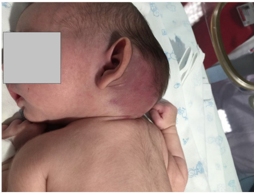
Figura 1 Tumoración cervical congénita de coloración violácea.

tros analíticos. Se realizó resección quirúrgica a los 13 meses de vida. A los 22 meses de vida mantiene buena evolución sin recidiva.