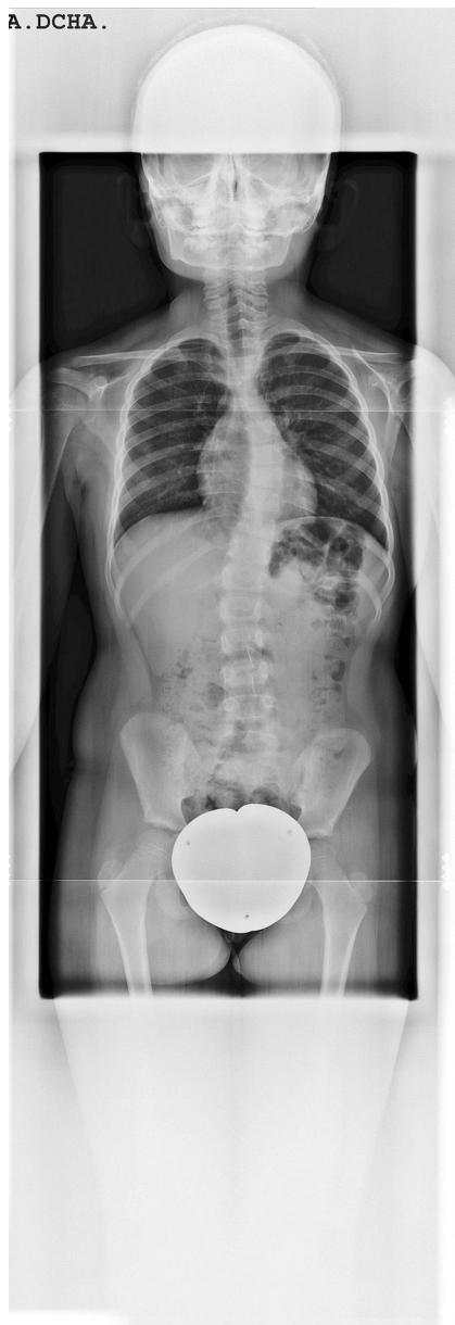
Figura 1 Curva dorsal de convexidad izquierda, ángulo de Cobb de 29,7^\circ entre D6-D7, y lumbar derecha de 8,6^\circ entre L2-L4. Dismetría de 1 cm a favor de la extremidad inferior derecha.